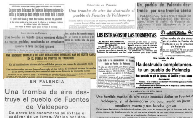
Figura 1 - Titulares aparecidos en la prensa nacional sobre el tornado de Fuentes de Valdepero. Julio 1935.

La prensa nacional e internacional, se hizo eco del suceso tras la inmediata visita del Gobernador de la provincia a esta localidad, próxima a la capital palentina, acompañado por reporteros, fotógrafos y los servicios de emergencia (Figura 1).