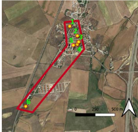
Figura 2- Imagen Google Satellite con los lugares de impacto identificados y la posible senda del tornado.

Se puede concluir que el día 12 de julio de 1935 se daban todos los ingredientes dinámicos, térmicos y de humedad favorables para la convección profunda y organizada en amplias zonas del centro peninsular (figura 3):